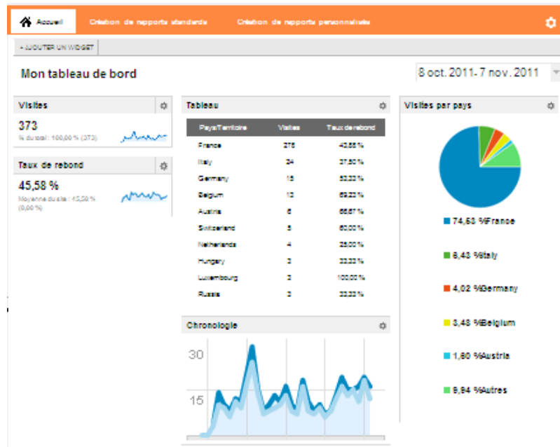
Tableau de bord du site